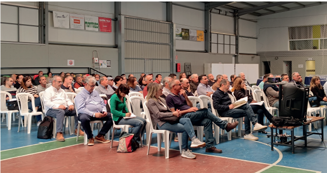
Fotografia 2: Assemblea socis FECOC